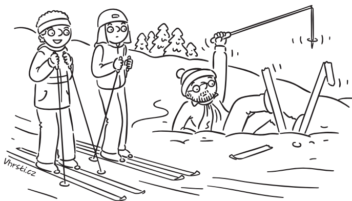
Vypadá to, že nad námi pan učitel definitivně zlomil hůl. A pro jistotu i obě lyže.