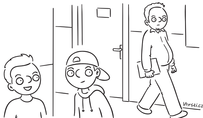
Prý odchází na otcovskou dovolenou. Vidíš, my jsme si mysleli, že má pivní mozol, a on je přitom těhotnej.

Snažíme se podporovat porozumění tématu zdravotního postižení. Každý rok se věnujeme danému tématu v našich článcích. V roce 2012 jsme získali cenu za článek VE ŠKOLE S AUTISTY .