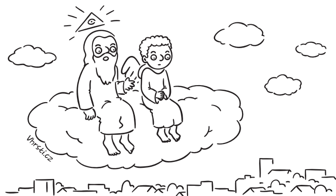
Možná jsme to tenkrát v Babylónu vůbec nemuseli řešit. Vždyť oni si nerozumí, ani když mluví stejným jazykem.